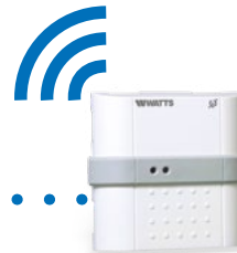
BT-FR02 RF Produit complémentaire exclu de l'offre package.