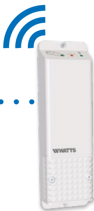
BT-WR02 FC RF